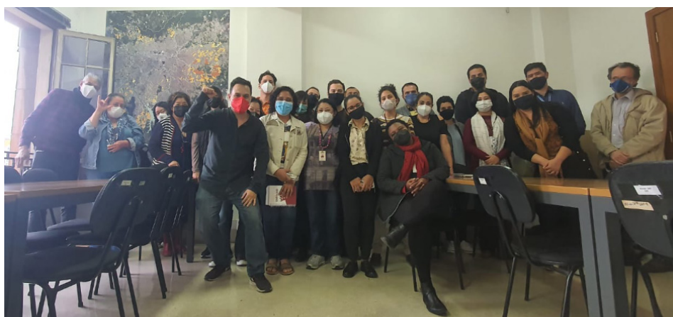
Reunião do Sindsep com servidores da SEHAB

Foi publicado no Diário Oficial do dia 06 de agosto, a nomeação dos novos assistentes sociais para SEHAB. No entanto, constava no documento que passados 15 dias da nomeação, se o candidato não se apresentasse na Secretaria de Habitação, ele deveria se apresentar na Secretaria Municipal de Assistência e Desenvolvimento Social – SMADS, para tomar posse nela. Na data foi esclarecido pelo secretário de SEHAB que houve um erro na publicação e