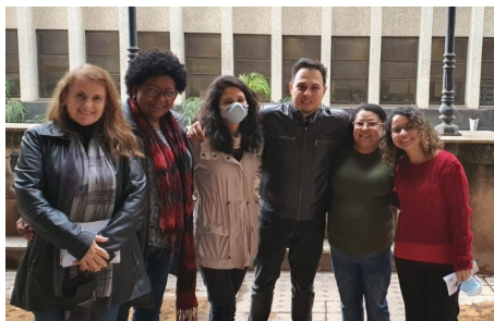
Servidoras/es de SEHAB na luta por melhores condições de trabalho