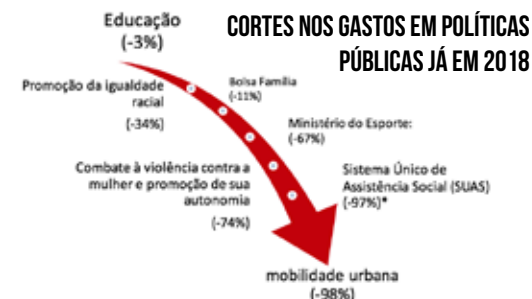
Fonte: http://www.inesc.org.br/noticias/noticias-do-inesc/2017/setembro/orcamento-2018-brasil-a-beira-do-caos * http://ptnosenado.org.br/lindbergh-temer-aprofunda-cortes-e-retira-pobres-do-orcamento-de-2018/

foi feito em nenhum lugar do mundo. A PEC já está valendo para 2018. Vejam os cortes que Temer já está impondo.