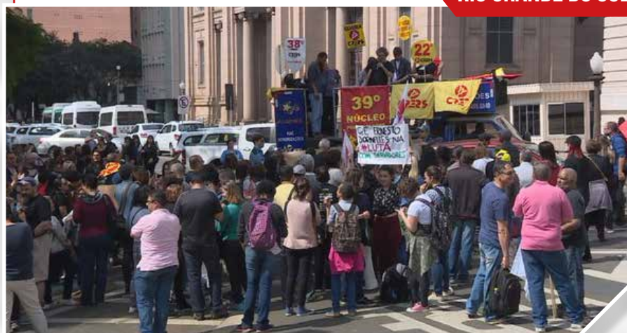
RIO GRANDE DO SUL

Os servidores estaduais gaúchos também tiveram de fazer greves contra salários parcelados e atrasados pelo governador Ivo Sartori (PMDB).